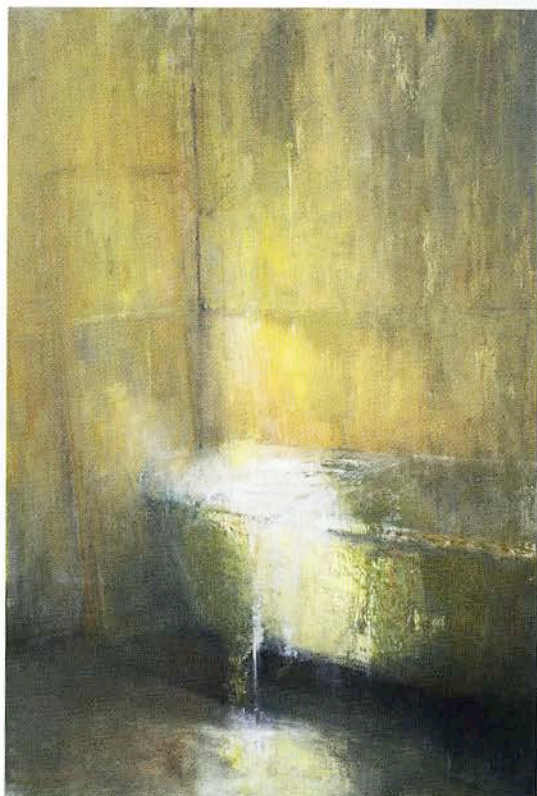
A gauche : Bain d'ocre , huile sur toile, 130 x 89 cm, 2016.